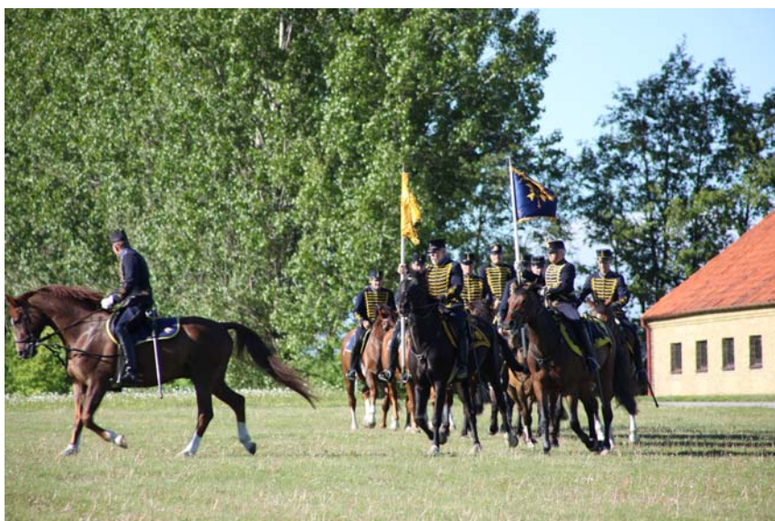
Hembygdsfesten på Alnarp inledde med en bejublade uppvisning av Kunglig skånska kavallerisquadron.