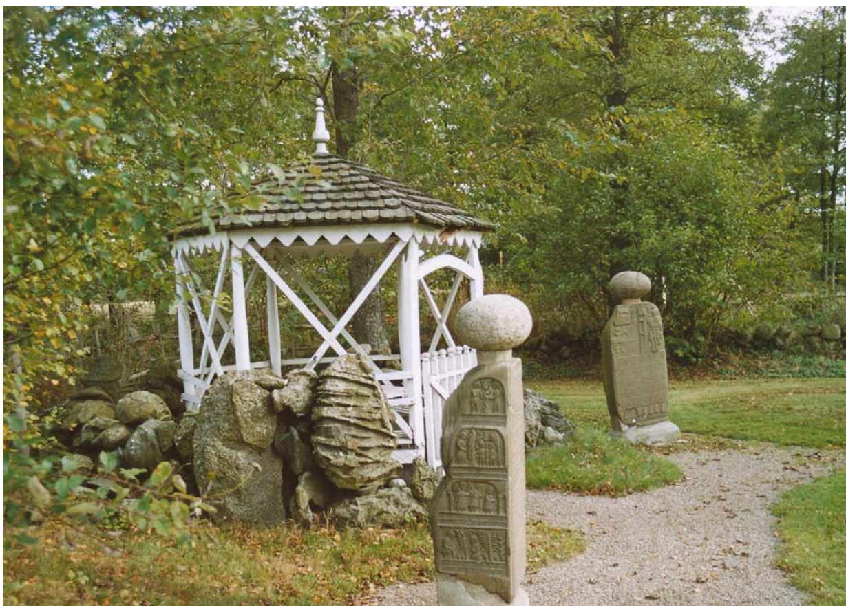
Hallsbergs stenar - ett av resmålen på resan Kulturskatter på Österlen .