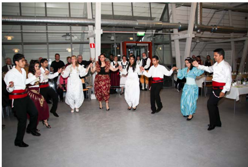
Unga dansare från Balkancentralen dansade romska danser på hembygdsfesten.